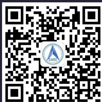
微信公众号二维码